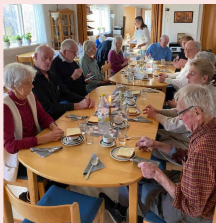
En bild från en av höstens välbesökta soppluncher.