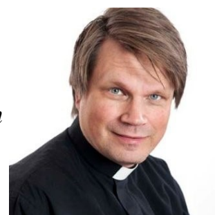
Församlingspräst Skagershults församling